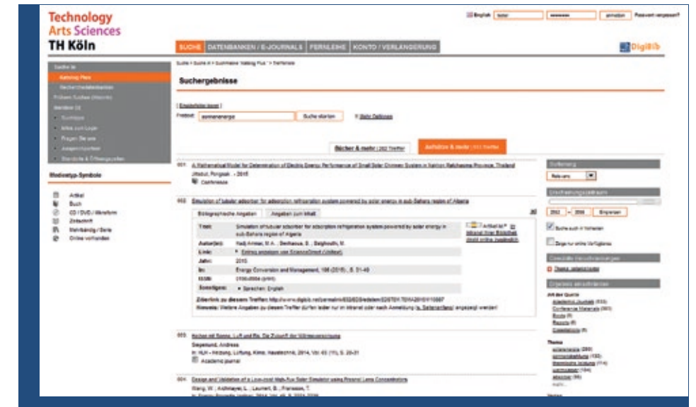
Trefferliste KatalogPlus (Integrierter EDS-Index – Hochschulbibliothek TH Köln)

DigiBib IntrX bindet einen mit Suchmaschinentechologie betriebenen Suchindex in die DigiBib ein. Dies kann ein vom hzb bereitgestellter oder ein kommerzieller Index (z. B. EBSCO Discovery Service, Primo Central, Summon) sein. Wie bei DigiBib IntrO werden auch hier unterschiedliche Inhalte und Funktionalitäten unter einer einzigen Suchoberfläche und einem einheitlichen Layout vereinigt. Die gleichzeitige Erweiterung der DigiBib um Suchindex und OPAC-Funktionalität ist mit der Version DigiBib IntrOX möglich.