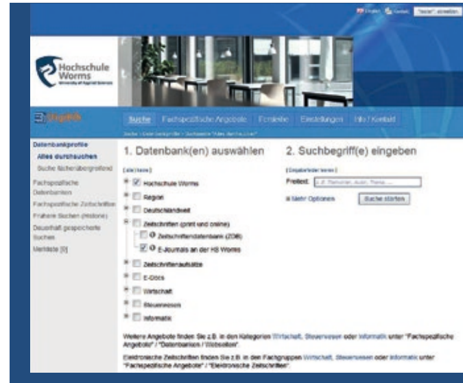
Suchmaske (Bibliothek der Hochschule Worms)